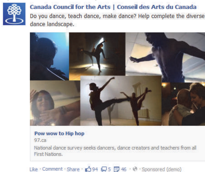
Figure 2 : Exemple d'affichage sur Facebook